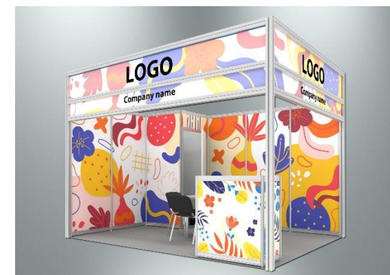
Пример оформления стенда с полноцветной оклейкой поверхностей (дополнительная услуга)