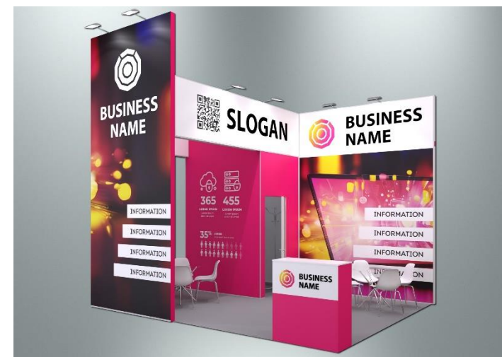
Пример оформления стенда с полноцветным оформлением поверхностей (дополнительная услуга)