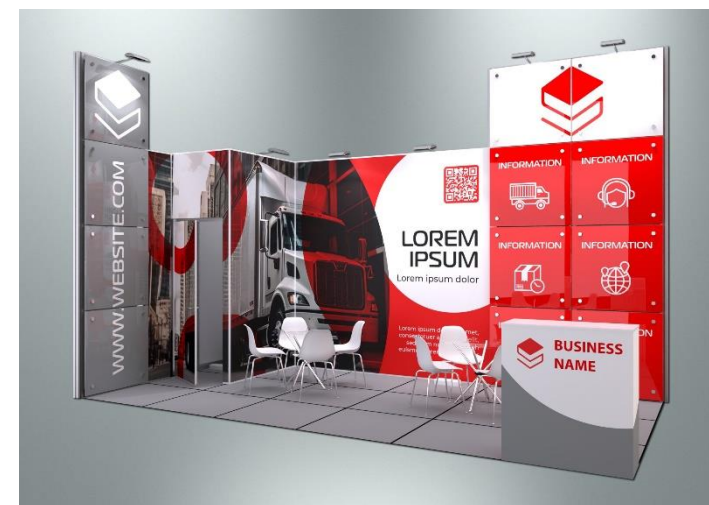
Пример оформления стенда с полноцветным оформлением поверхностей (дополнительная услуга)