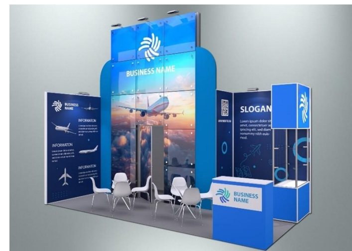
Пример оформления стенда с полноцветным оформлением поверхностей (дополнительная услуга)