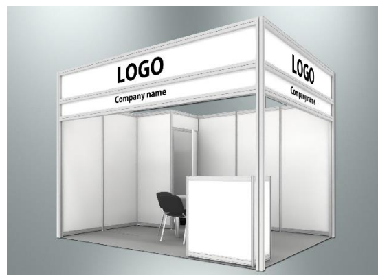
Пример стандартного оформления стенда

Стенд будет находиться в окружении ключевых игроков отрасли в местах с самым большим трафиком посетителей.