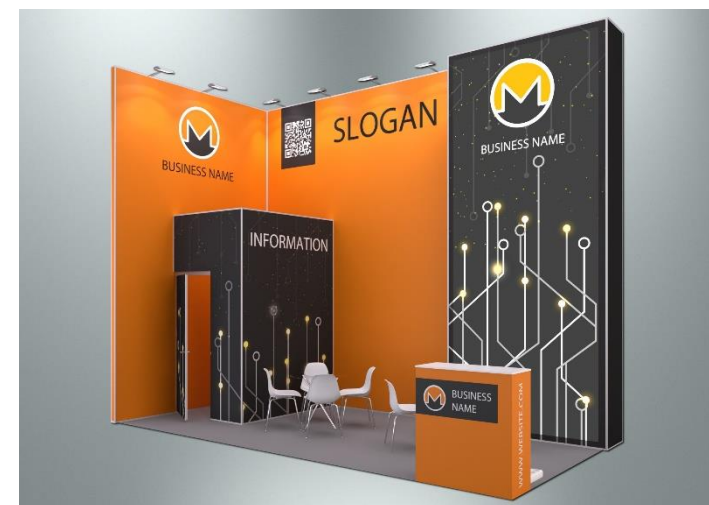
Пример оформления стенда с полноцветным оформлением поверхностей (дополнительная услуга)