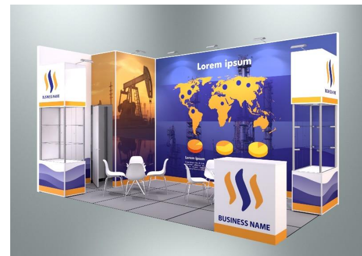
Пример оформления стенда с полноцветным оформлением поверхностей (дополнительная услуга)