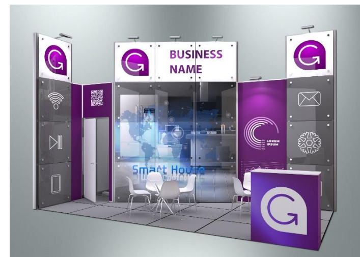
Пример оформления стенда с полноцветным оформлением поверхностей (дополнительная услуга)