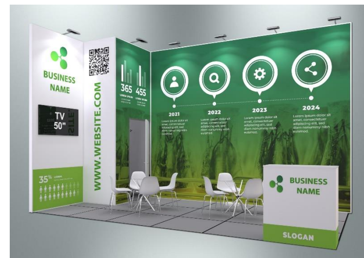
Пример оформления стенда с полноцветным оформлением поверхностей (дополнительная услуга)